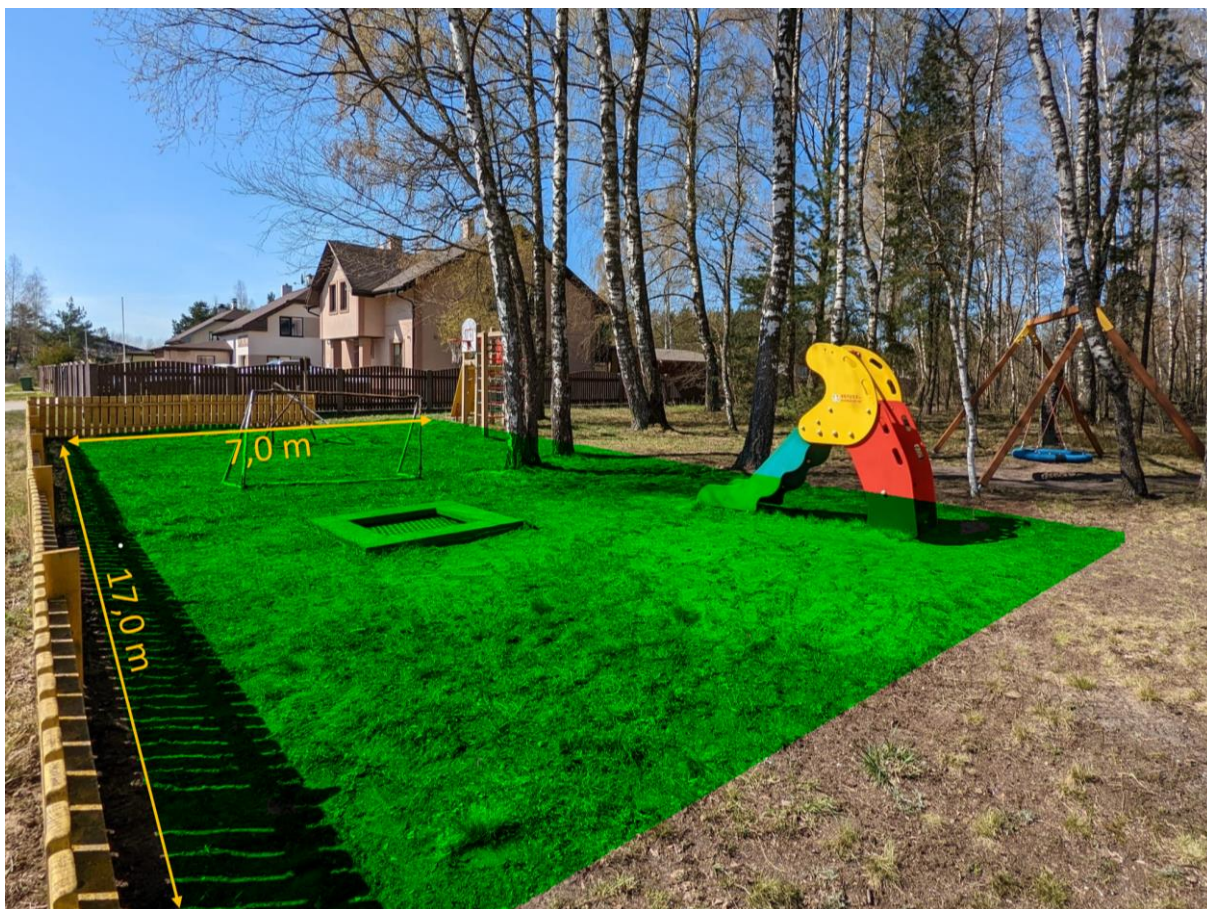
Attēls 4: Projekta ieceres novietojuma shēma

2. ieceres skices, grafiskie un topogrāfiskie materiāli, kas attaino tā novietojumu, telpisko apjomu un iekļaušanos vidē