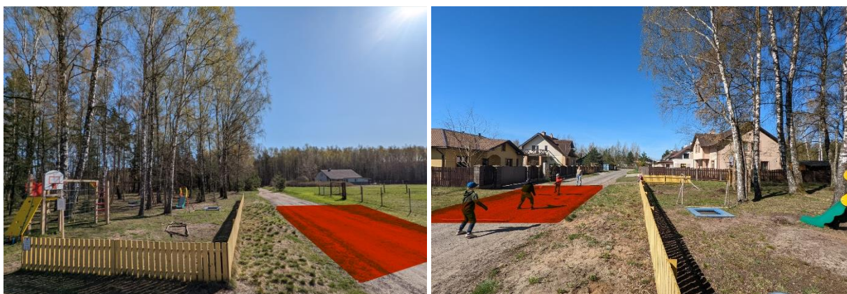
Attēls 1 un 2: esoša situācija

Tāpat Rotaļlaukumā tiek spēlēts mini futbols, kuru vārti ir samontēti no zaru stumbriem (to ierīkojot kādam no ciemata iedzīvotājiem). Raotaļlaukumā ir ierīkots arī strītbumbas grozs, taču zemes klātnes paugurainības un smilšainības dēļ tas tiek izmantots retāk.