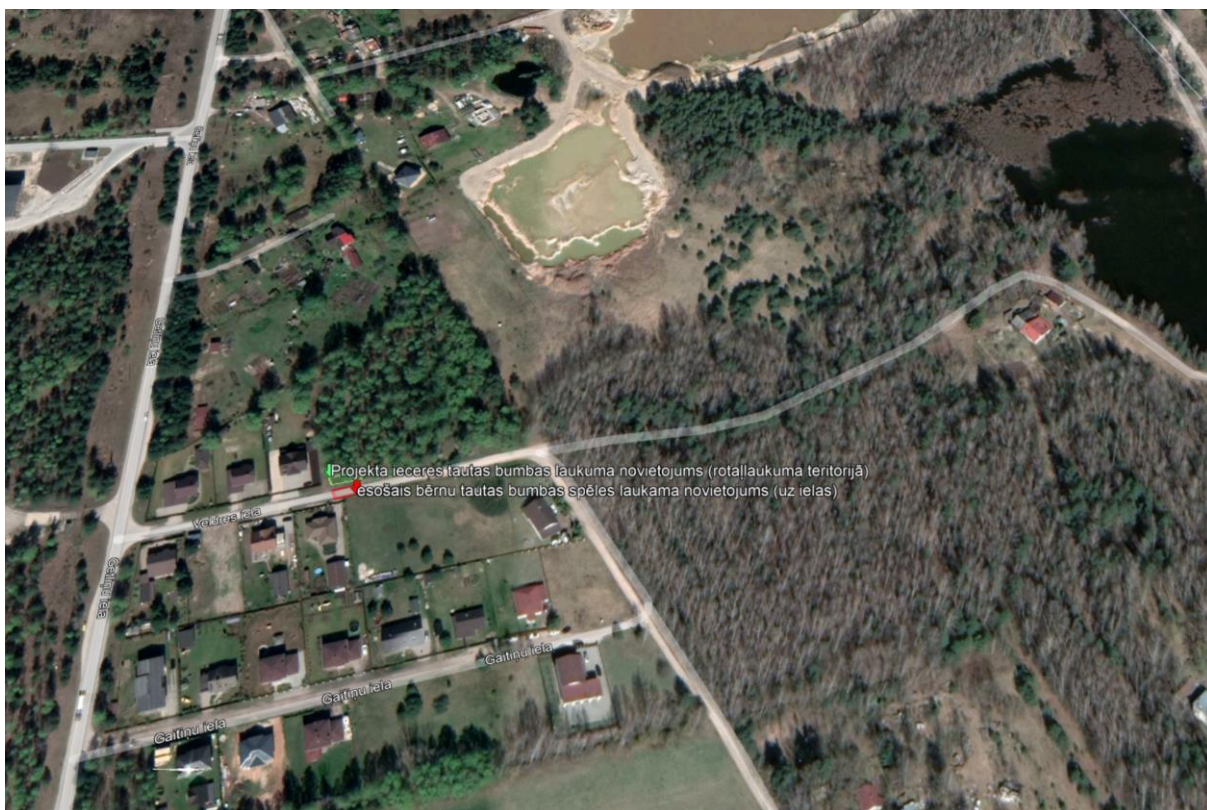
Attēls 5: Novietojuma shēma