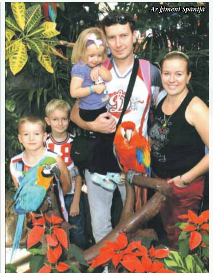
Ar ģimeni Spānijā

KB: Iemesls radās tā, ka, iespējams, bija kaut kādi saimnieciski jautājumi, neapmierinātība iedzīvotāju grupā. Mēs bijām ļoti