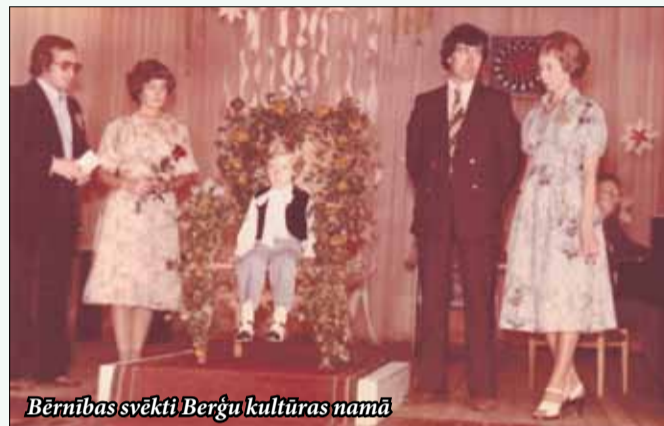
Bērnības svētki Berģu kultūras namā