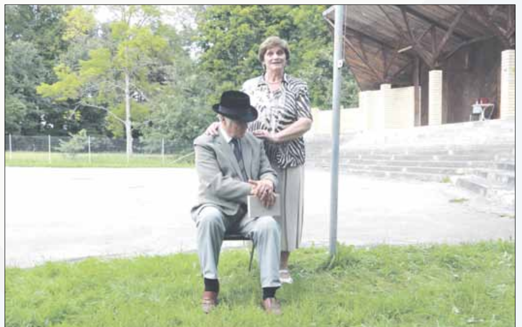
Mūsu stāsts par Jāni Jaunsudrabiņu