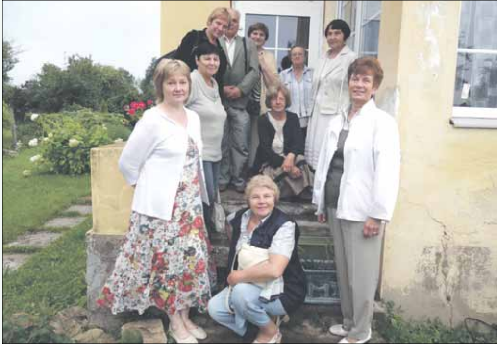
Mēs uz Jaunsudrabiņa mājas kāpnēm

Ierosme nāca no Aizkraukles novada domes Dienas centra „Pīlādzis”, kurš ir apzinājis visus Latvijas „Pīlādžus” un aicina 6. septembrī uz pieredzes apmaiņas salidojumu, iesakot šovasar tomēr vienam otru apciemot un tuvāk iepazīt. Mēs izvēlējamies Varakļānu senioru klubiņu „Pīlādzītis”, braucot pie kura mēs iegrieztos arī Pļaviņās, lai apskatītu Jāņa Jaunsudrabiņa pirms 100 gadiem celto māju Kalnu ielā 11, kur viņš nodzīvoja 22 gadus.