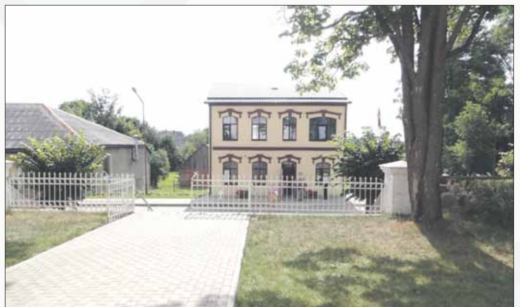
Skaisti atjaunota ēka Dienas centram