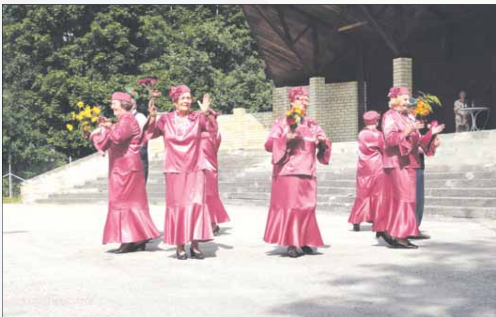
Dejo Varakļānu „Vēlziedes”