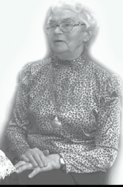
Garkalnes novada Pensionāru padome