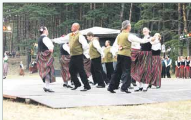
Pierīgas danči (G. Skujas horeogrāfija)