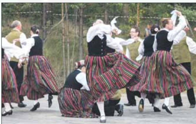
Vai domāji, vai cerēji (J. Ērgļa horeogrāfija)