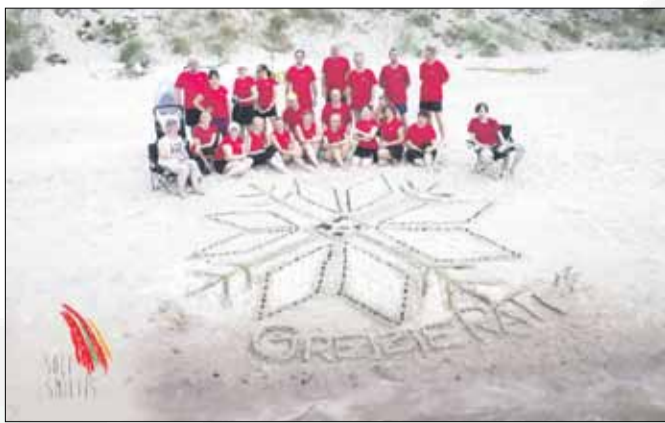
„Greizie rati” 14. Piejūras VPK festivālā „Soļi smiltīs”