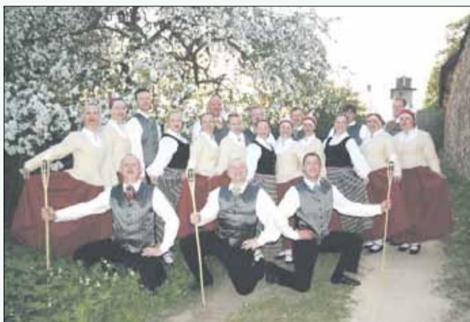
Muzeju nakts koncerts š. g. 17. maijā Šlokenbekas muižā