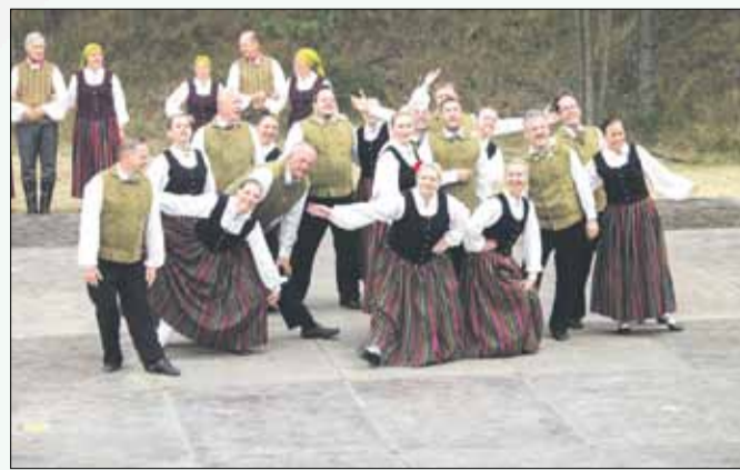
Es nenācu šai vietā (A. Daņiļeviča horeogrāfija)