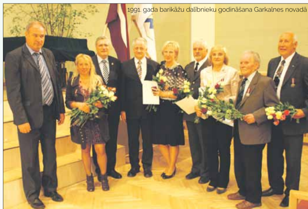
1991. gada barikāžu dalībnieku godināšana Garkalnes novadā

tam, aizej tur... Tādā veidā es to Zemessardzi te sāku organizēt.