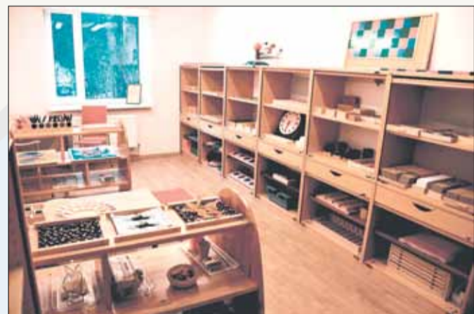
„Palīdz man to veikt pašam!” Marija Montesori

Garkalnes Mākslu un vispārīgizglītojošajā vidusskolā turpina paplašināt bērnu attīstības iespējas.