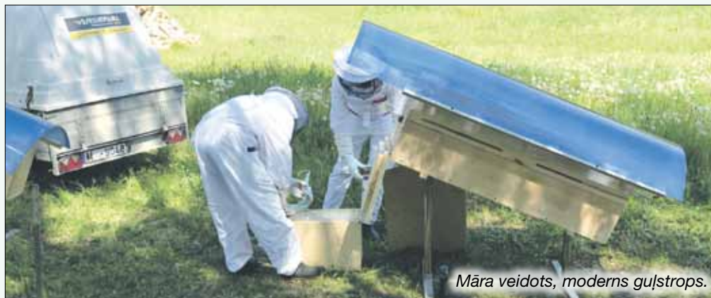
Māra veidots, moderns guļstrops.