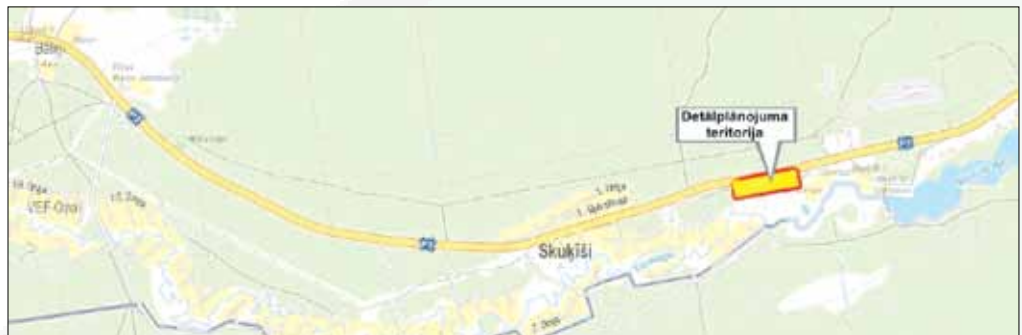
(Detālplānojuma teritorija atrodas starp autoceļu P3 (Garkalne-Alauksts) un Tumsūpi)

Garkalnes novada dome 2017.gada 28.novembra sēdē pieņēma lēmumu Nr.212 „Par detālplānojuma jauna ceļa pievienojuma valsts autoceļam P3 (Garkalne-Alauksts) izveidei projekta apstiprināšanu” (protokols Nr.8, 1.§).