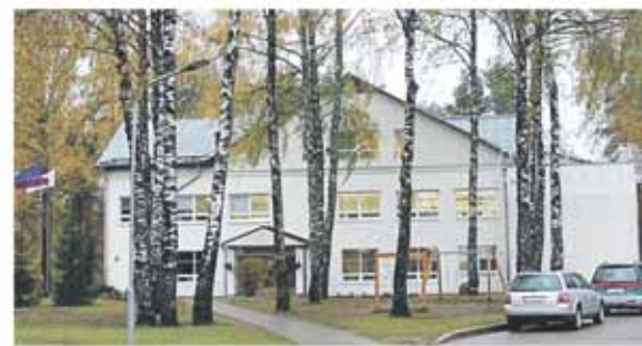
Berģu Mūzikas un mākslas pamatskola