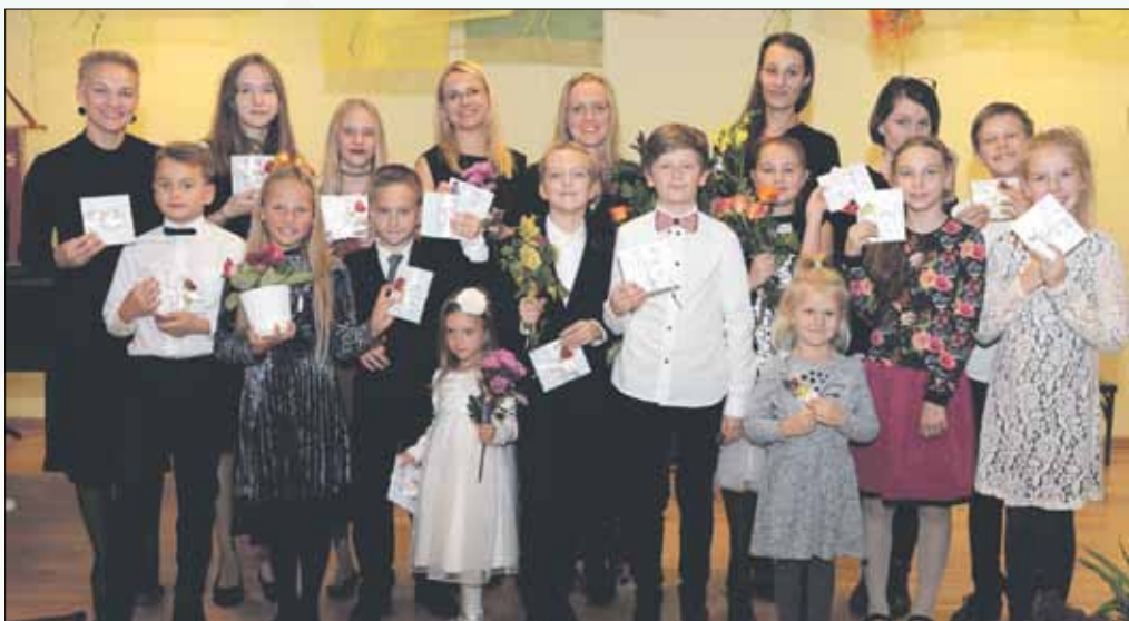
Projekta dalībnieki albuma “Ziemas stāsts” prezentācijas koncertā Garkalnes skolā.

Šovasar, 2019. gada 2. jūlijā, tika nodibināta Garkalnes novada labdarības biedrība “SIRDS MĀJA”, kuras galvenais mērķis ir palīdzēt bērniem un jauniešiem attīstīt viņu talantus.