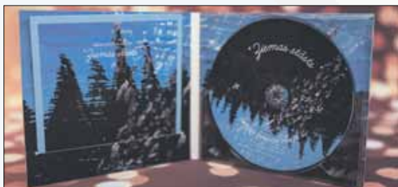
Albuma priekšpuse un iekšpuse