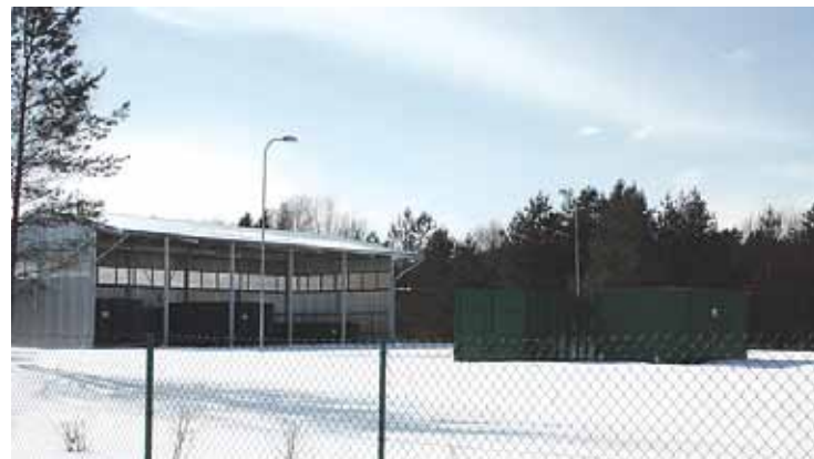
Atkritumu šķirošanas laukums Taurēnos, Zaķumuižā.

Zaļās krāsas konteineri – stikla atkritumiem. Tajos drīkst mest: stikla burkas, pudeles, kā arī logu stiklu. Pirms mešanas burkas un pudeles jāizskalo no ēdienu un dzērienu paliekām. Zaļajos konteineros nedrīkst mest: netīru stikla taru, spoguļu stiklu, automašīnu stiklu, pudeles, kas satur plastmasas piemaisījumu.