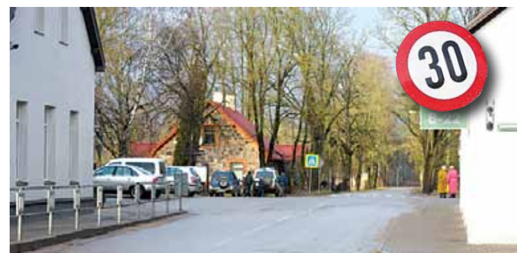
Paredzamais braukšanas ātrums Ropažu centrā

Vienlaikus tika lūgts koriģēt zīmes "Dodiet ceļu" atrašanās vietu Tumšupes un SAC "Ropaži" krustojumā un uzlabot satiksmes organizāciju krustojumā ▶ 2. lpp.